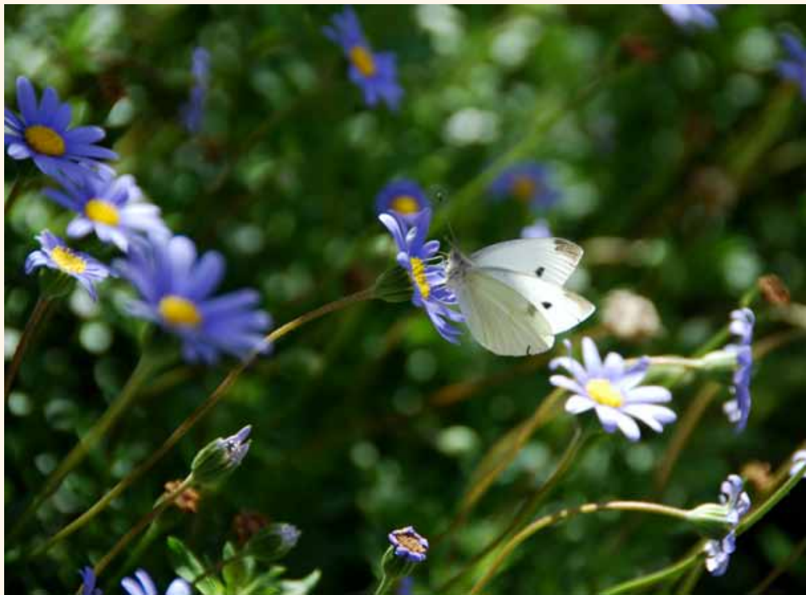
只要我們有開放的心胸，以及探索的熱情和勇氣，便能讓世界走進來。

到澳洲，專欄文章當然也以他們旅居澳洲的家庭生活和校園生活為主軸。這趟搬遷，之華又為台灣讀者開啟了另一扇世界之窗。