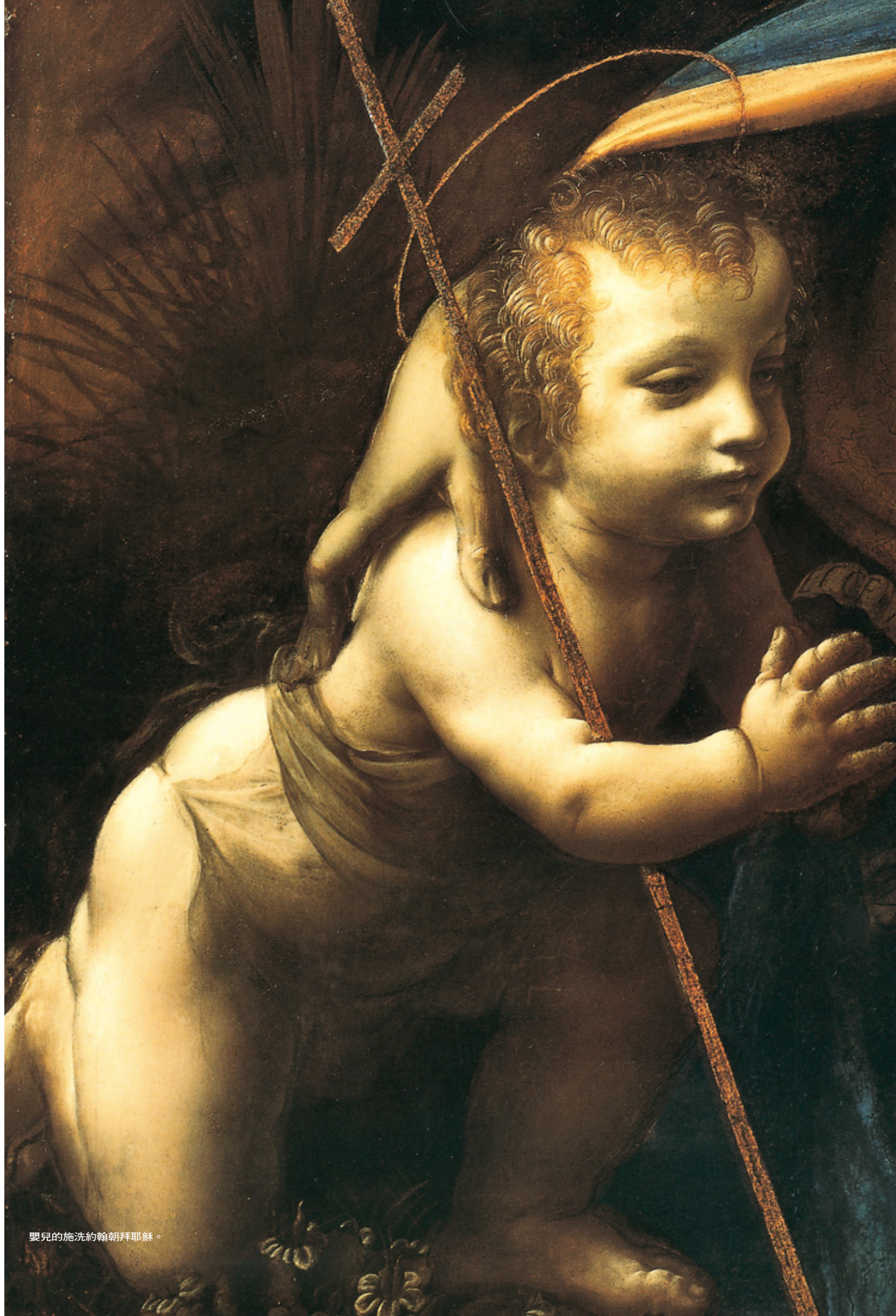
嬰兒的施洗約翰朝拜耶穌。