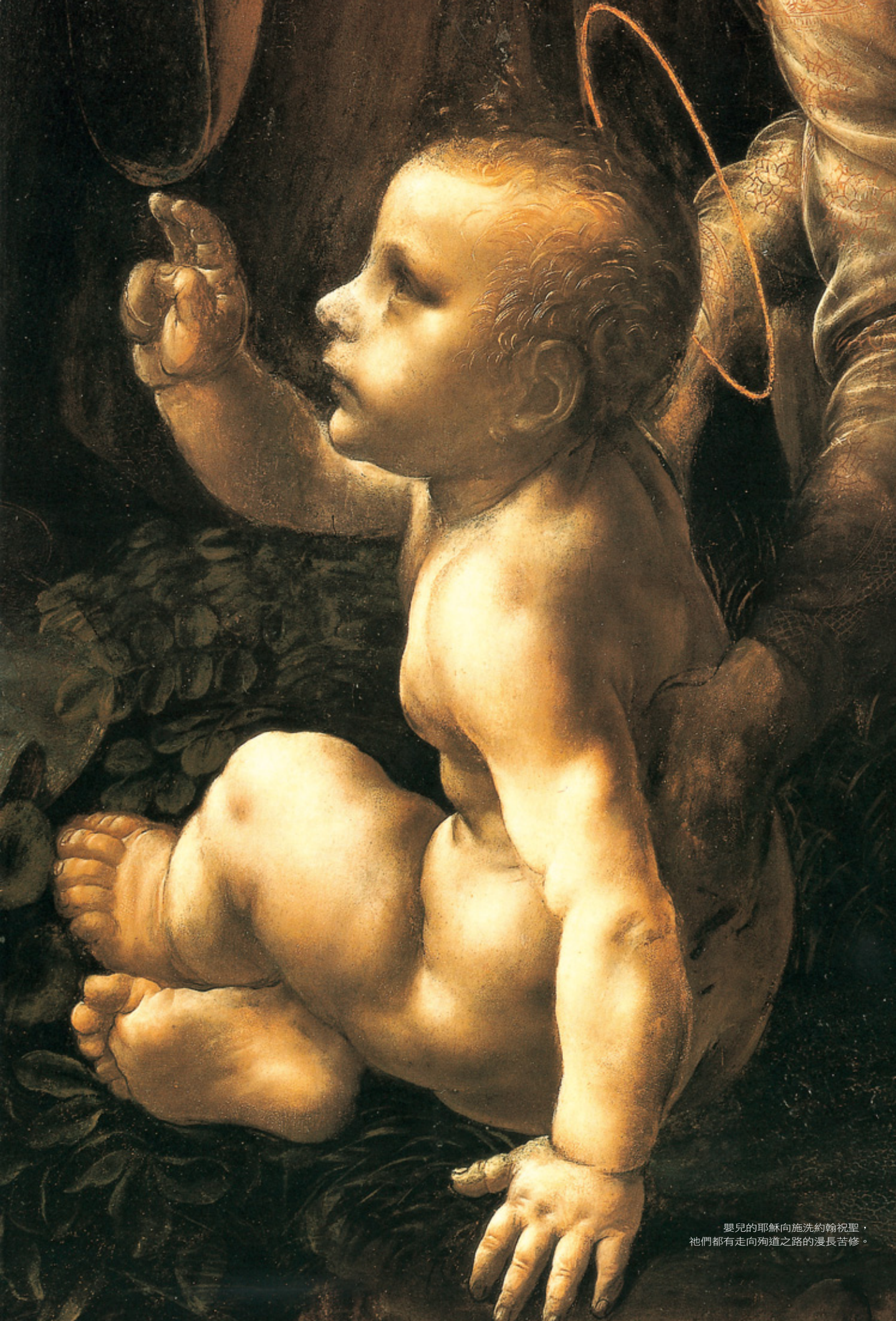
嬰兒的耶穌向施洗約翰祝聖， 他們都有走向殉道之路的漫長苦修。