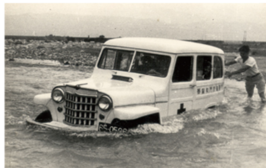
8. 利用巡迴醫療的機會，從孩子著手，推廣公共衛生教育。(1965)