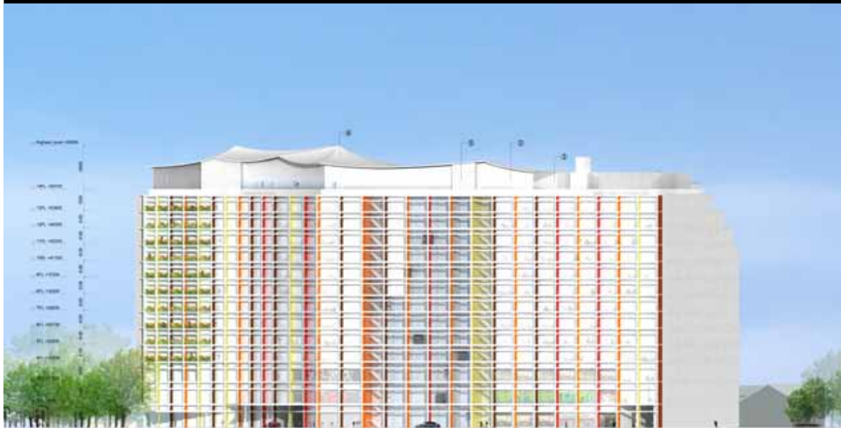
① 低沖梁型高耐性鋼筋混凝土構造 ② 鋼骨・鋼筋コンクリート構造 ③ 金型設置 ④ 中DGA PL 表面積熱処理・漆塗 ⑤ 成形中定水廻轉 鋼・鋼・鋼 ⑥ 西暦

這個延宕多年的台北巨蛋與松山菸廠開發BOT案，在伊東豐雄的加持之下似乎終於有了新的局面。期待伊東所設計的這件作品能夠成為城市商業建築未來的典範，並順利地為台北市最後的都心地帶，創造出一片可享受自然環境，並可與藝術文化完美交融的休閒場所。