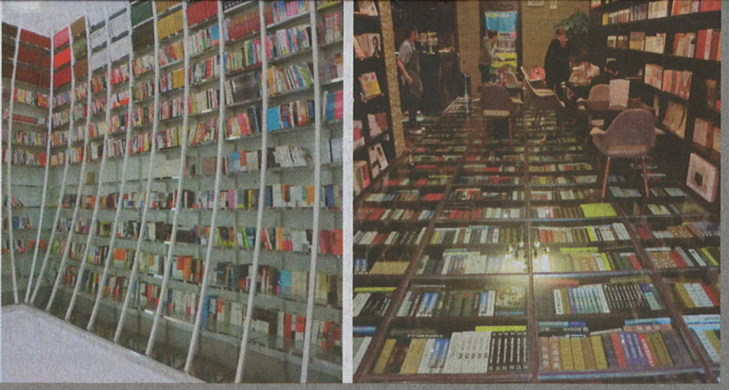
右上圖上海最美的書城「鍾書閣」外觀。 右圖左為鍾書閣裡頭的「天堂書房」，設計給人後現代的感觉。右圖右鍾書閣的地板用透明玻璃做成，底下放滿各式各樣的書。

【記者林庭瑤／台北報導】陸委會昨天授權海基會就協商兩岸服務貿易協議的時間、地點等相關安排，與大陸海協會展開磋商。