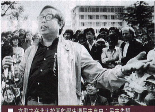
方勵之在北大校園向學生講民主自由：民主先驅

後，不管到劍橋或到美國以後，大家都希望他出來做政治人物。我給你透露一點，我們出來以後，李潔明都口頭講，方教授，我們這次跟中共談判非常成功，我只不過傳信而已，因為你的智慧使我們做得非常成功，他半開玩笑地說，你不如從政算了。方勵之當時笑了，他說他最大興趣是做科學研究。 他對這幾年大陸的改革開放有何看法？經濟上有些成就，政治上沒有任何進步。他在劍橋時，一位他的學生，也是他的朋友，寫了一篇紀念文，提到有一天他們在一起聊天，就聊到這個事情，這學生問說經濟好像要開放了，但政治不開放，你覺得怎麼